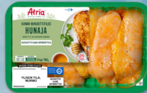
Atria Kanan Minuuttifilee Hunaja 780g - 6 filettä

TILAJÄLJITETTÄVÄÄ MÄÄRÄKAPPALEET MERKITY PAKKAUKSIIN