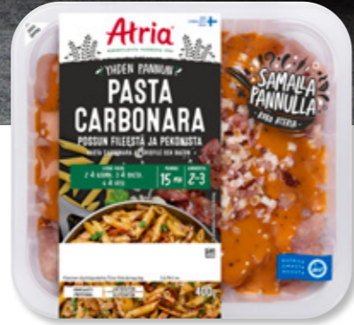
Atria Yhden Pannun Pasta Carbonara 400g