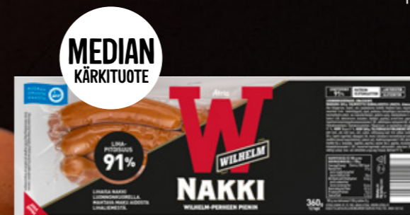
Atria Wilhelm Luonnonkuorinakki 360g