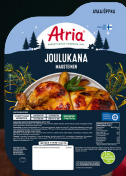
Atria Joulukana Mausteinen n. 1,7kg