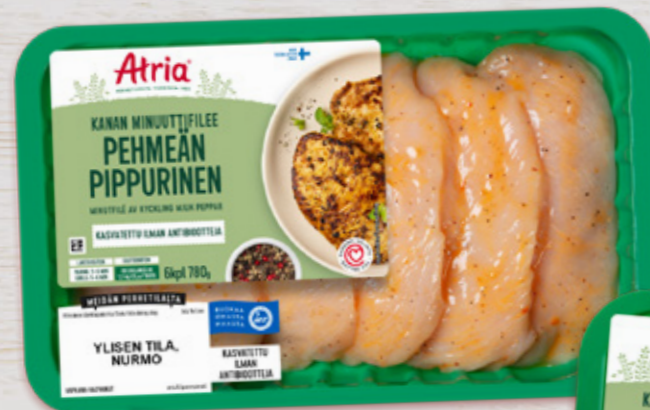
Atria Kanan Minuuttifilee Pehmeän Pippurinen 780g - 6 filettä

Syksyn uudistuksessa tarjoamme myös kuluttajien toivoman uudistuksen tarkasta filemäärästä pakkauksessa. 88% kuluttajista kokee, että pakkauksen sisältämien fileiden lukumäärä on tärkeä tieto. Tänä syksynä uudistuneesta vihreästä pakkauksesta tuttujen tilajäljitettävyyden ja antibioottivapauden lisäksi Atrian kanaa ostaessa kuluttaja voi olla varma myös pakkauksen sisältämien kanafileiden määrästä.