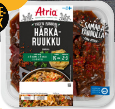
Atria Yhden Pannun Härkäruukku 350g