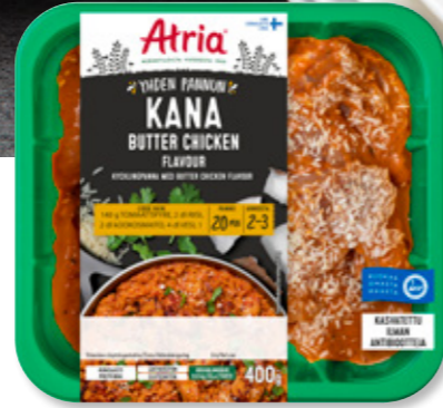
Atria Yhden Pannun Kana Butter Chicken 400g