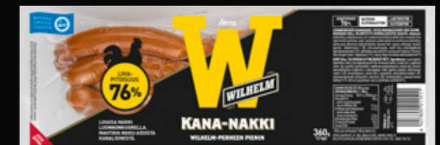
Atria Wilhelm Kuorellinen Kananakki 360g