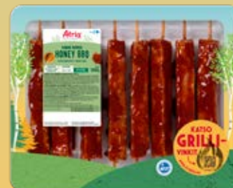
ATRIA HONEY BBQ KANAN VARRAS 1000G