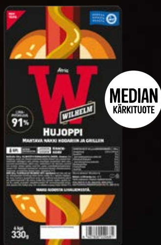
ATRIA WILHELM HUIJOPPI NAKKI 330G

KOHDERYHMÄ: Aikuiseen makuun, mutta myös lapsiperheet pitivät tuotteesta.