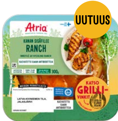
ATRIA KANAN SISÄFILEE RANCH 300G

KOHDERYHMÄ: Aikuistaloudet ja pienet perheet