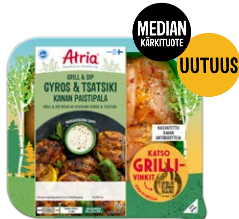
ATRIA GRILL & DIP KANAN PAISTIPALA GYROS & TSATSIKI 350G

KOHDERYHMÄ: Pariskunnat ja pienet perheet