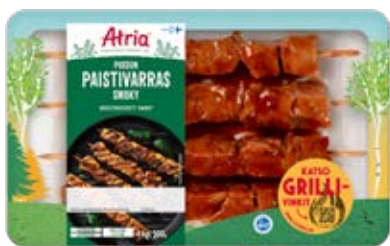
ATRIA POSSUN PAISTIVARRAS SMOKY 500G