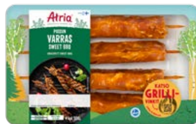
ATRIA POSSUN VARRAS SWEET BBQ 500G