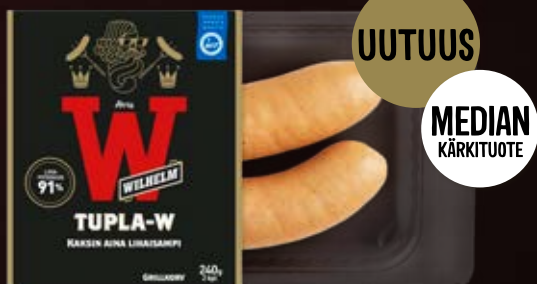
ATRIA WILHELM TUPLA-W 240G

Wilhelm paistattelee suomalaisen grillimakkaran ystävien suosiossa kategoriansa preferoidumpana ja kevään MM-kisojen yhteydessä jälleen myös kiekkokansan huomiolla. Kesällä nähdään uutuudet kahtena, kun sesonkimaun lisäksi esitellään uusi entistäkin lihaisampi Wilhelm-tulokas - uudessa kahden makkaran pakkauskoossa.