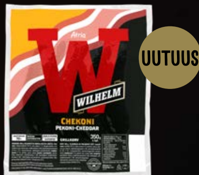
ATRIA WILHELM CHEKONI PEKONI-CHEDDAR 350G