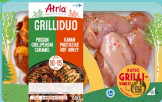
ATRIA GRILLIDUO 650G