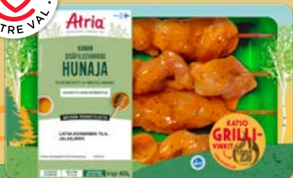
ATRIA KANAN SISÄFILEEVARRAS HUNAJA 400G