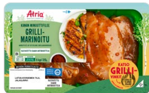
ATRIA KANAN MINUUTTIFILEE GRILLIMARINOITU 720G

Minuuttifileiden grillikauden ikiklassikko, jossa maistuu perinteiset grillimausteet kuten paprika, valkosipuli ja chili.