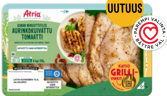
ATRIA KANAN MINUUTTIFILEE AURINKOKUIVATTU TOMAATTI 720G

KOHDERYHMÄ: Lapsiperheet ja aikuistaloudet, kun grillataan useammalle hengelle