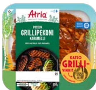
ATRIA POSSUN GRILLIPEKONI KARAMELLI 350G