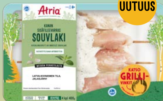
ATRIA KANAN SISÄFILEEVARRAS SOUVLAKI 400G

KOHDERYHMÄ: Lapsiperheet ja aikuistaloudet, kun grillataan useammalle hengelle