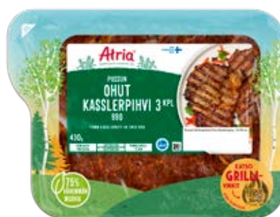
ATRIA POSSUN OHUT KASSLERPIHVI BBQ 430G