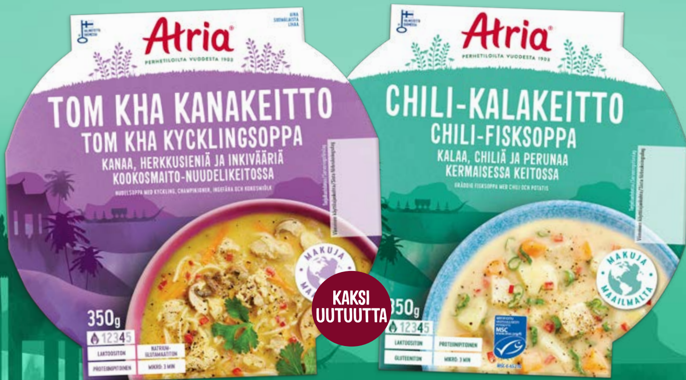
ATRIA TOM KHA KANAKEITTO 350G

Vastuullisesti pyydettyä kalaa chilillä maustetussa kermaisessa keitossa. Chili tuo keittoon ihanaa mausteisuutta ja lämpöä kalan pehmeän maun rinnalle.