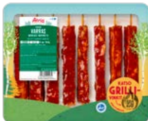
ATRIA POSSUN VARRAS BBQ-MARINOITU 1KG