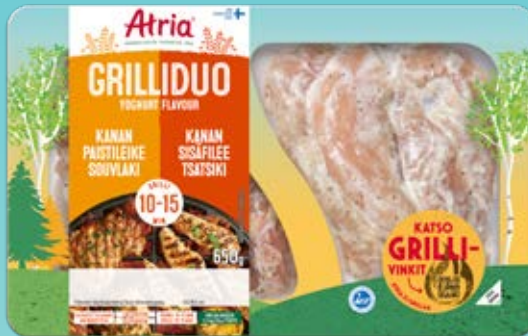
ATRIA GRILLIDUO YOGHURT FLAVOUR 650G