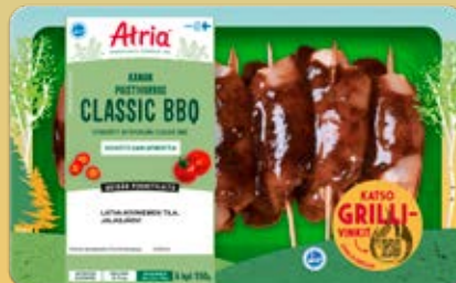
ATRIA KANAN PAISTIVARRAS CLASSIC BBQ 550G