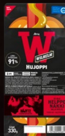
Atria Wilhelm Hujoppi Nakki 330g 617368 Me 4 kpl