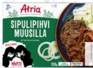
Atria Sipulipihvi Muusilla 350g

TAVOITTAUVUUS: Kampanja tavoittaa 70 % 25-64-vuotiaista kuluttajista, painottuen erityisesti miehiin.