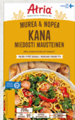
Atria Murea & Nopea Kana Miedosti Mausteinen 200g

Atria Mureat ja Nopea -tuotteita käytetään ensisijaisesti lämpimien ruokien valmistuksessa, jolloin kokolihamainen ulkonäkö pääsee oikeuksiinsa. Käyttäjissä korostuvat erittäin vahvasti lapsiperheet (35-49-vuotiaat). Pakkaukseen lisäksi myös pakkauksen ulkoasu päivittyi.