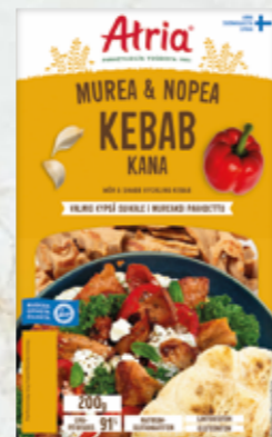
Atria Murea & Nopea Kana Kebab 200g