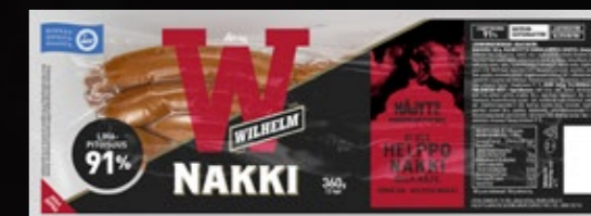
Atria Wilhelm Luonnonkuorinakki 360g 7418 Me 4 kpl 617394 Me 50 kpl