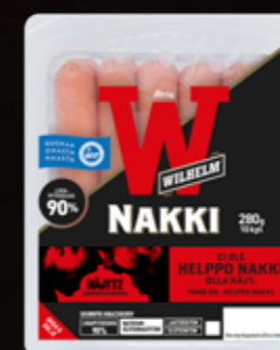
Atria Wilhelm Kuoreton nakki 280g 7563 Me 6 kpl