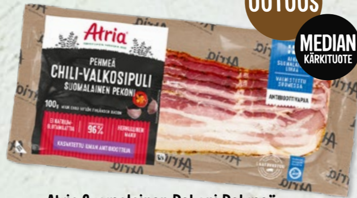
Atria Suomalainen Pekoni Pehmeä Chili-Valkosipuli 100g