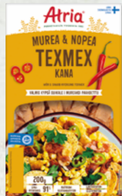
Atria Murea & Nopea Kana TexMex 200g