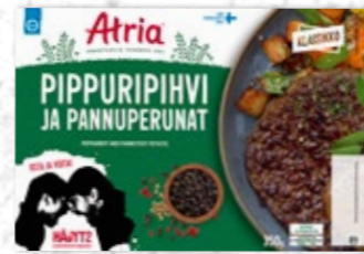
Atria Pippuripihvi ja Pannuperunat 350g