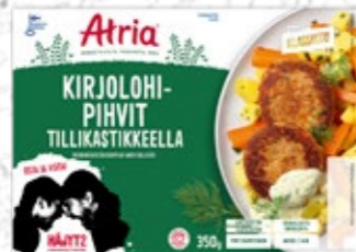
Atria Kirjolohi- pihvit Tillikastikkeella 350g