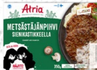
Atria Metsästäjänpihvi Sienikastikkeella 350g